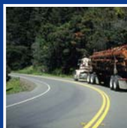
Entretien des Routes