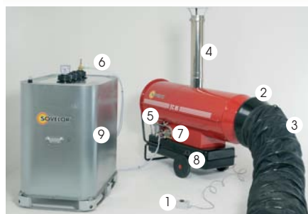
* sauf EC 22