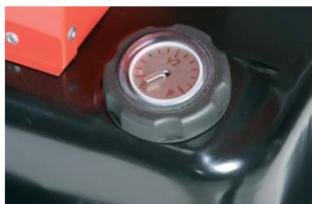
jauge de carburant

Les EC bénéficient en série d'équipements facilitant leur usage : jauge de carburant, support de rangement de