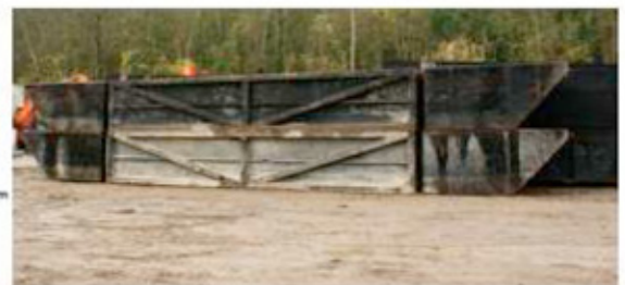
Schéma / photos