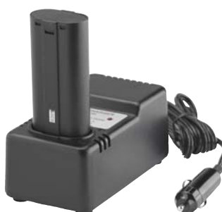
Avec l'option chargeur 12V cc, vous pouvez même recharger votre MLP120 Mikrofynd à partir de l'allume-cigare de votre voiture.