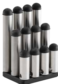
Le MLP120 Mikrofynd assure à l'entrepreneur une flexibilité accrue avec une installation sur 3 ou 4 pieds et différentes longueurs de pieds.