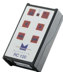
La télécommande du MLP120 Mikrofynd intègre le DirectDrive™ = aucune attente.