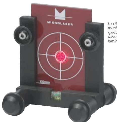
La cible du MLP120 est munie d'un revêtement spécial conférant au faisceau déjà vif une luminosité maximale.

Très vif, le faisceau assure une visibilité excellente quelle que soit la luminosité. Le dispositif optique spécial fournit un faisceau de grande qualité. Un télescope facilitant la cible peut être installé sur le MLP120.