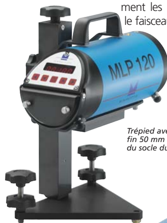
Trépied avec réglage vertical fin 50 mm (2") de la hauteur du socle du trépied.

Le MLP120 vous permet d'effectuer un centrage automatique du faisceau. Pousser simplement les 2 boutons et le faisceau est centré.